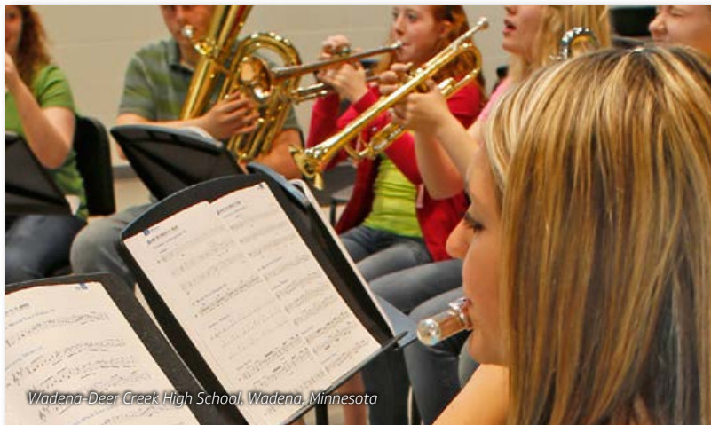
Wadena-Deer Creek High School, Wadena, Minnesota

Atril de policarbonato ultraliviano que se flexiona, pero nunca de dobla ni se abolla como el metal.