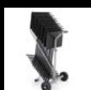
Carros para atriles