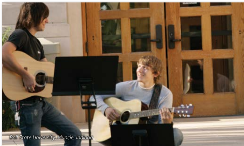
Ball State University, Muncie, Indiana

El atril Gig de Wenger es el más resistente, sólido, creativo y portátil que se haya construido hasta hoy.