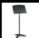
Atril Classic 50°