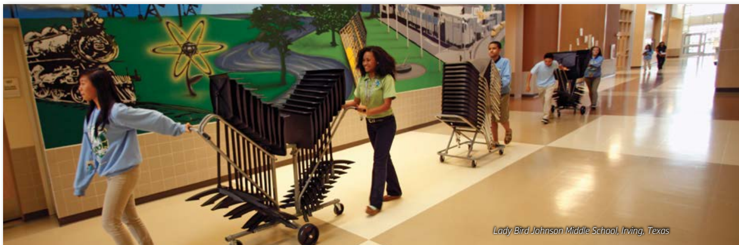
Lady Bird Johnson Middle School, Irving, Texas

Traslade y almacene sus atriles en un práctico carro.