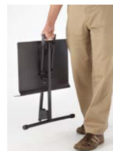
El Gig Stand también se pliega, lo que lo hace ideal para llevar su música cuando viaja.