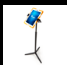
Soportes para tabletas