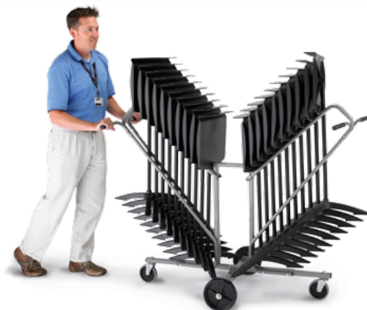
El carro grande de traslado y almacenamiento de atriles se muestra con 20 atriles Classic 50.