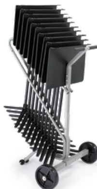
El carro pequeño de traslado y almacenamiento de atriles se muestra con 10 atriles RoughNeck.