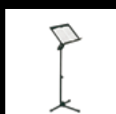
Atril plegable Gig Stand®