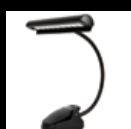
Lámparas para atriles