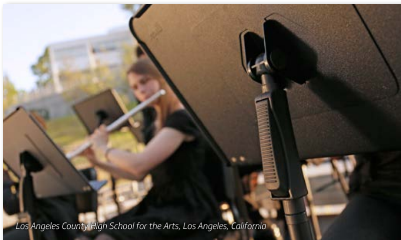
Los Angeles County High School for the Arts, Los Angeles, California

Atril duradero, fabricado completamente en acero.