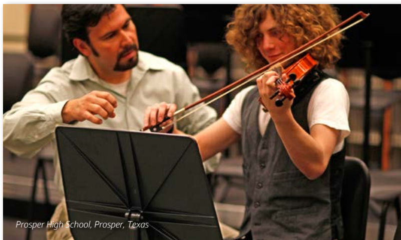
Prosper High School, Prosper, Texas

Apariencia clásica y diseño sofisticado, junto con una durabilidad inigualable.