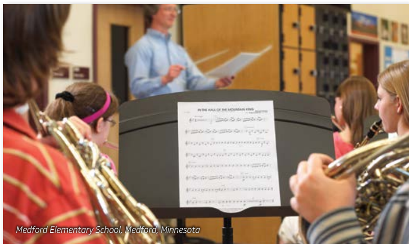
Medford Elementary School, Medford, Minnesota

El atril de metal superliviano es, a la vez, el más asequible.